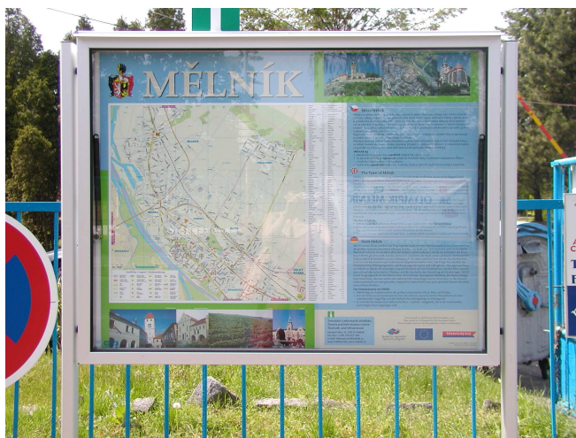
velkoplošný informační a orientační plán